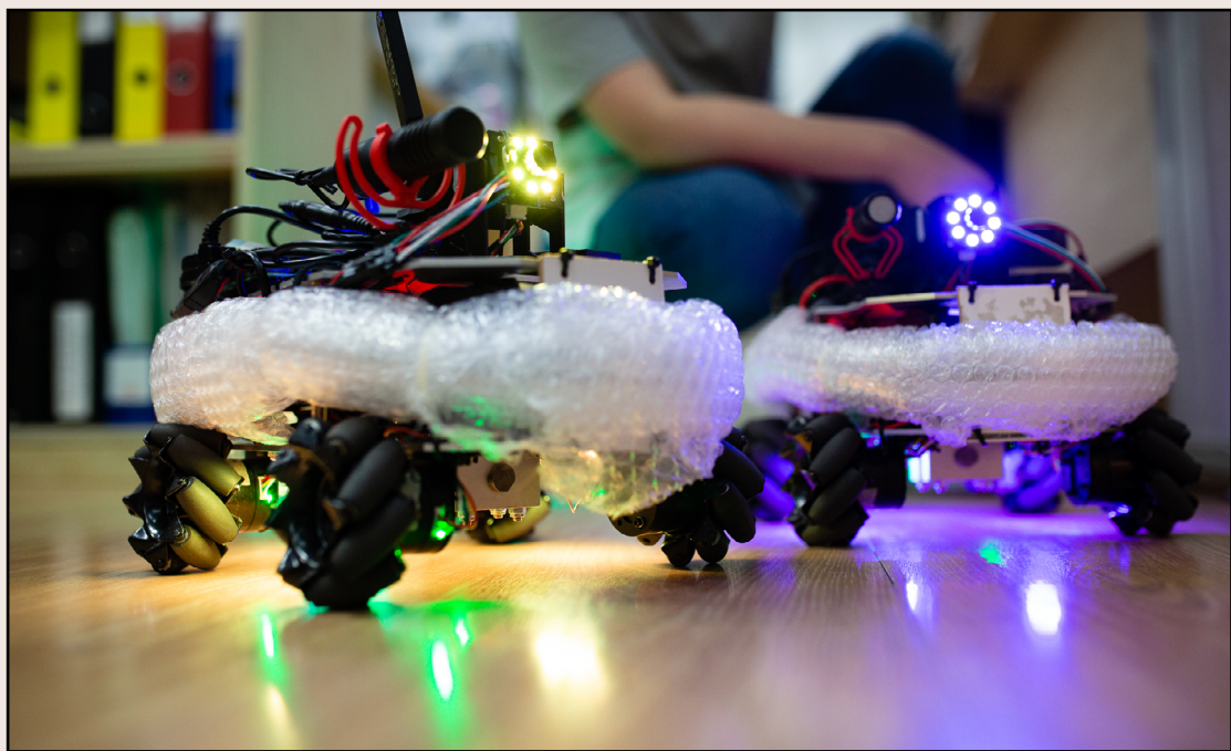
《遙距在場》（2021）的遙控車

「新視野藝術節」以全新形象及形式發佈「更新視野」網上演藝平台，五個作品中只有一個現場演出，另外四個作品以互動網站、音樂微電影、聲音、虛擬實境呈現。香港藝術發展局特別資助的「Arts Go Digital藝術數碼平台計劃」，支持了五十八個小型及十個大型的、應用當代科技的藝術創作，當中不乏劇場藝術家的身影。執筆之時，大部分Arts Go Digital的作品還未發表，如同線上播放的好處是無遠弗屆，線上劇場能否為本地劇場開出一條新路徑，大家拭目以待。