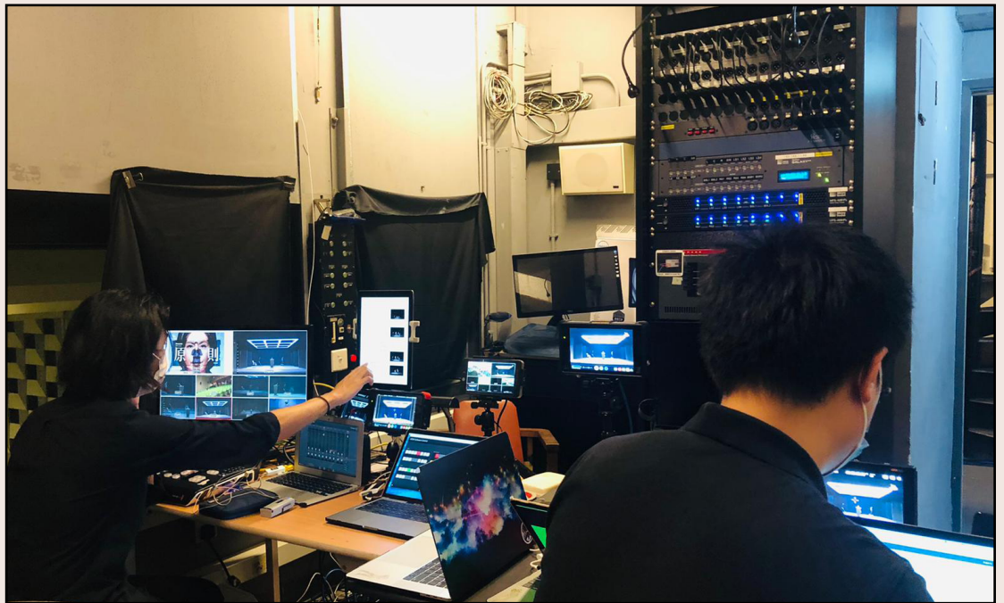
《原則》（2020）直播現場

難以突破同溫層去吸納更多大眾。國外有線上表演藝術串流平台Marquee TV，以月費形式讓觀眾無限時觀看全球不同類型的表演藝術。當然，要與全球表演藝術團隊競爭，製作的完成度需求更高，以現時本地的資助模式未必能夠立刻提升質素，但九大藝團絕對有空間去嘗試。香港亦開始有類似的串流平台出現，為了抗疫，電子商貿發展大大提升，政府有資助中小企轉營及數碼化的計劃，本地藝術團體又能否借助其他界別的資源去拓展網上平台？